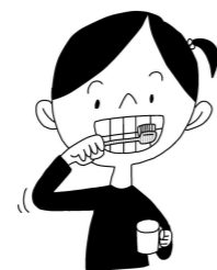
毎日しっかり歯みがき