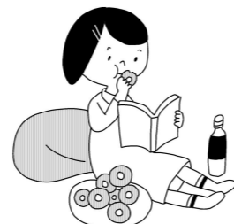
あまいものをダラダラ食べない